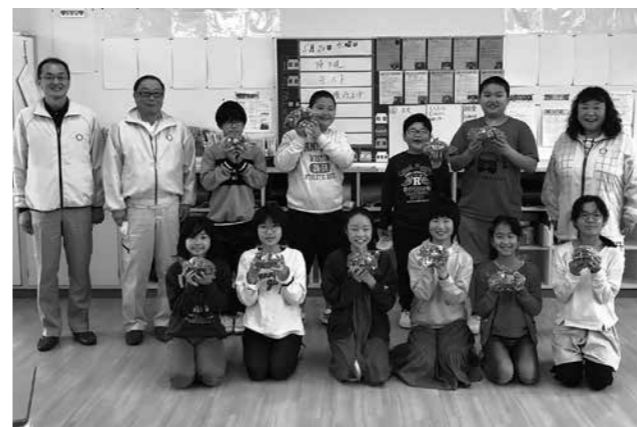
赤崎いちごを受け取る鶴川小学校児童ら

ロータリークラブでは、例年5月に児童をイチゴ園に招き、イチゴ狩りの交流活動を行っています。今年は新型コロナウイルス感染症拡大防止のため、交流会は中止となりましたが、いちご生産組合の協力で、採れたてのいちごを児童らに贈呈しました。