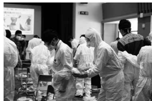
協力して防護服を脱ぐ参加者ら

能登町では、病院職員や消防職員、町職員、福祉関係者など43人が参加し、陸上自衛隊第14普通科連隊・金沢駐屯地隊員らから防護服の正しい着脱方法などを学びました。隊員によるデモンストレーションの後、参加者は二人一組となり、防護服やマスク、手袋、ゴーグルなどの着脱を体験しました。初めて着用する防護服に「暑くてマスクも苦しい」「一度経験すると万一のときに役立つ」などの声があり、感染防止のためのよい訓練となりました。