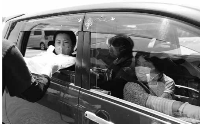
ドライブスルーで能登弁当を受け取る家族連れ