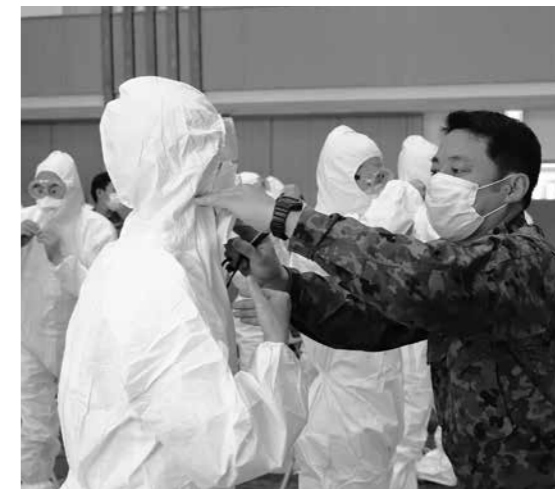
正しく着用できているか念入りに確認