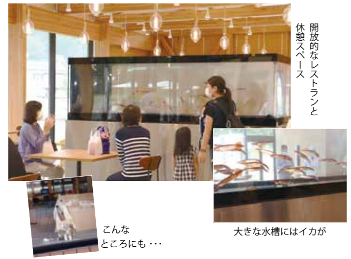
開放的なレストランと休憩スペース

駅長のおすすめ・・・「景観」 日本百景九十九湾を周遊する遊覧船のほか、シーカヤックやサップ、スキューバダイビングと言ったマリンスポーツを楽しめます。これまで奥能登ではマリッジ施設を本格的に体験できる施設はありませんでした。興味のある方はぜひ1度遊びに来てください。お子様連れでも安心できるよう、ベテランのガイドが九十九湾を案内します。