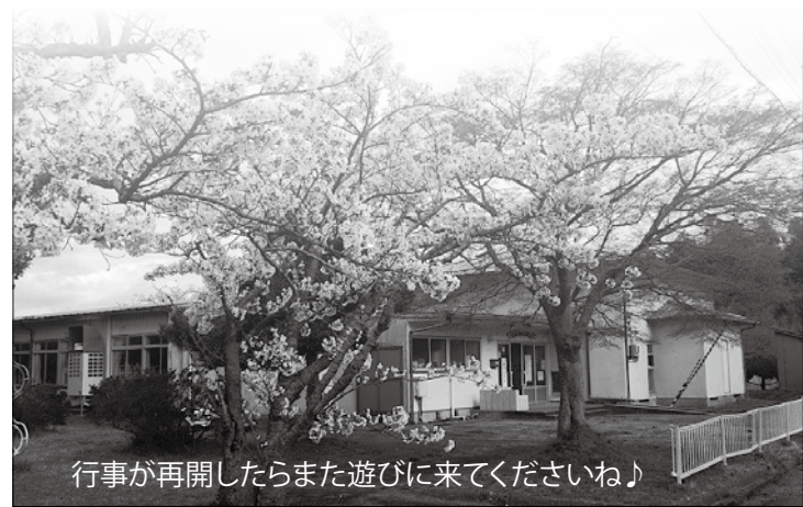
行事が再開したらまた遊びに来てくださいね♪