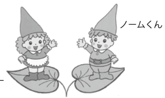
イメージキャラクター ノームちゃん