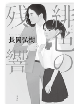
緋色の残響 長岡 弘樹/著

ピアノ教室で生徒が急死した。死因は食物アレルギー。不慮の事故と思われたが、犯人の存在が浮上し…「傍聞き」のシングルマザー刑事 & 新聞記者志望の娘が主人公の連作短編集。