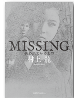
MISSING 失われているもの 村上 龍/著

この女優に付いていってはいけない。小説家は、母の声に導かれ彷徨い続ける。『限りなく透明に近いブルー』からひと筋に続く創造の軌跡！5年ぶり、待望の長編小説！