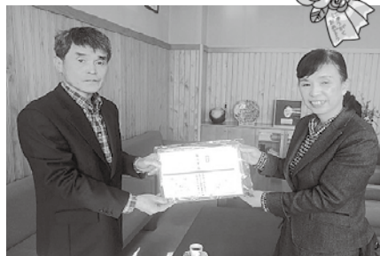
防犯委員からグッズを受け取る柳田小学校長

処分場所以外の場所に廃棄物を投棄したり、野外で焼却することは、法律で禁止されています。