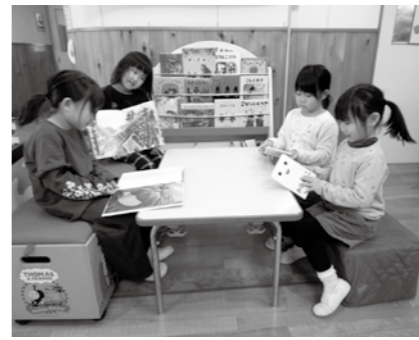
贈られた絵本を楽しんで見ている鶴川保育所の子どもたち

公益社団法人輪島法人会より、鶴川保育所に絵本、柳田保育所にガス給湯器、上町保育所に座卓の寄贈がありました。この寄贈は、同会の社会貢献活動の一環として児童福祉の充実に目的に毎年実施されています。寄贈いただいた物品は、保育のために活用し、日々の活動に役立てられます。