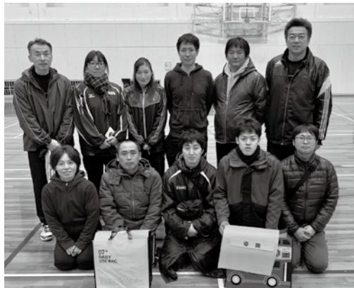
優勝した木郎走志会Aのみなさん