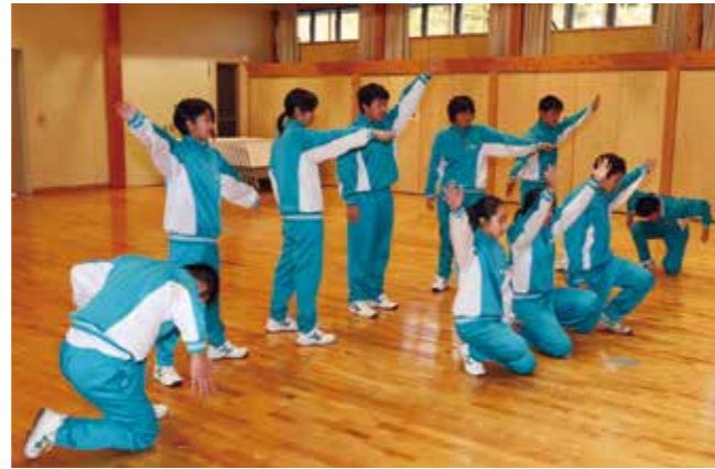
ダンスを披露する松波中学校2年生のみなさん