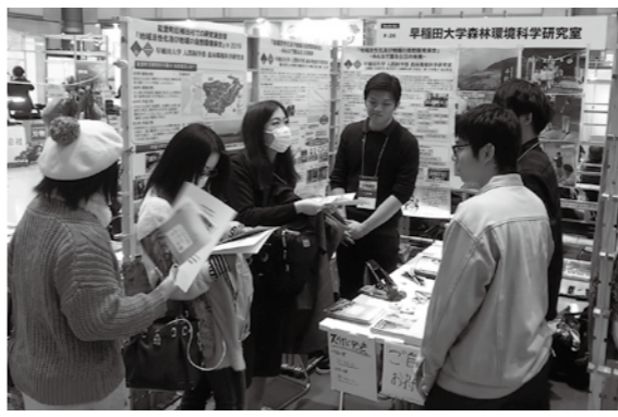
来場者に合宿成果を説明する学生ら

昨年9月に町内で合宿し、里山の振興策などを探った早大森林環境科学研究室の学生らは12月5日から3日間、都内で行われた展示会「エコプロ2019」で成果発表を行いました。不足する世代間の交流促進に向けて学生が提案したのは会員制交流サイト(SNS)の活用で、地元の若手グループがSNSを通じた情報交換に乗り出しました。