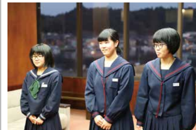
(左から) 橘さん、榎木さん、大桐さん