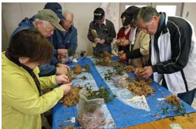
英国へ贈る苗木の発送準備をする会員ら

会員らが一昨年9月から町内の専用ハウスで苗木を育て、12月2日に「本霧島」や「八重霧島」など10品種を初めて発送しました。育成を待って今春以降に、南部の都市サウサンプトンにある「エクスペリーガーデン」に植樹されます。