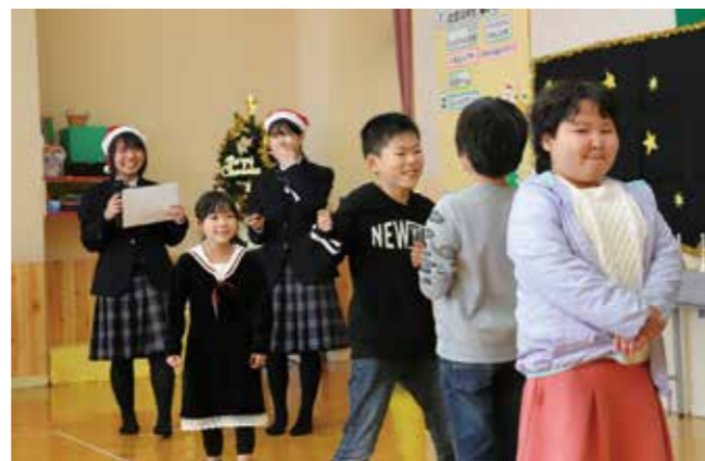
ジェスチャーによる伝言ゲームを楽しむ子どもたち

全国大会では残念ながら入賞を逃しましたが、生徒らは練習の成果を十分に発揮しました。