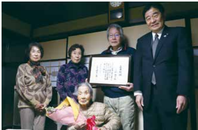
お祝いの花束を手に記念撮影しました

上結さんは子3人、孫8人、ひ孫が9人おり、この日は同居の長男のほか、長女、三女がお祝いに駆けつけました。92歳まで和裁の仕事をし、今でもほとんどのことは自分でできるとのこと、とてもお元気なご様子でした。