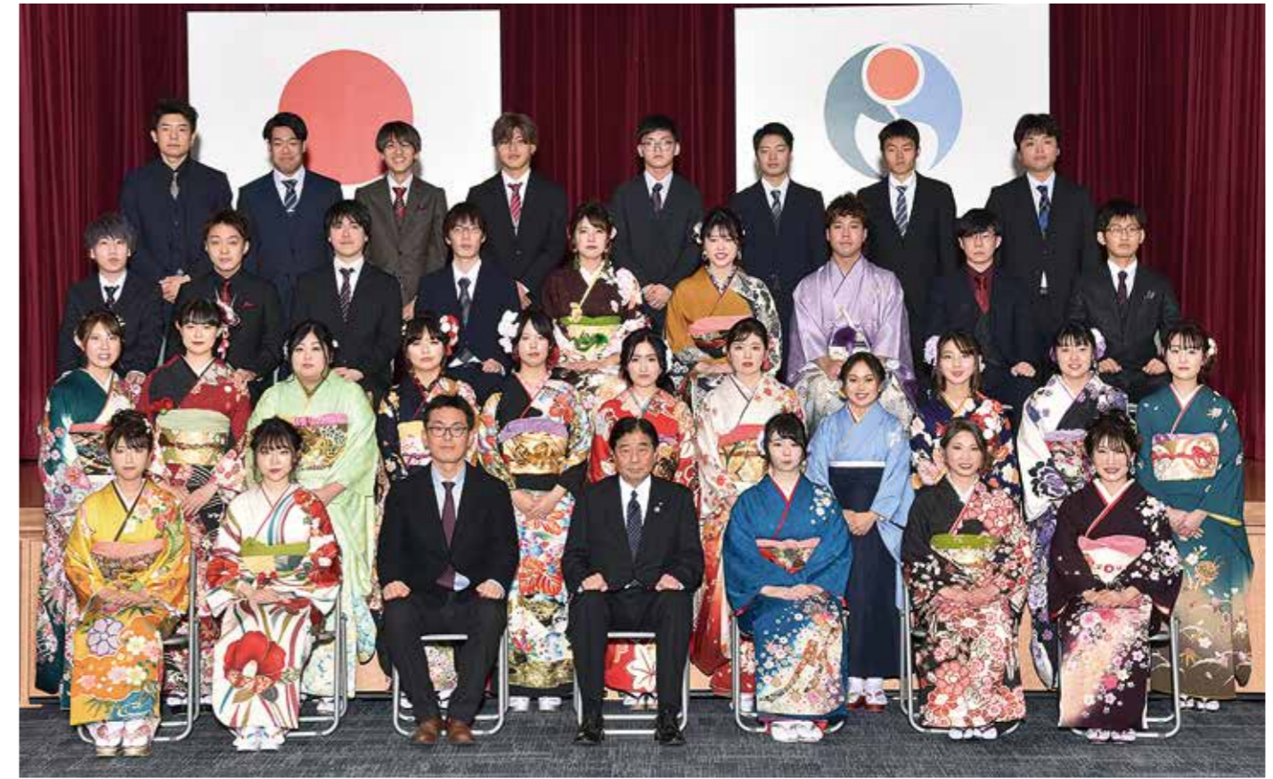
能都中学校 1組卒業生