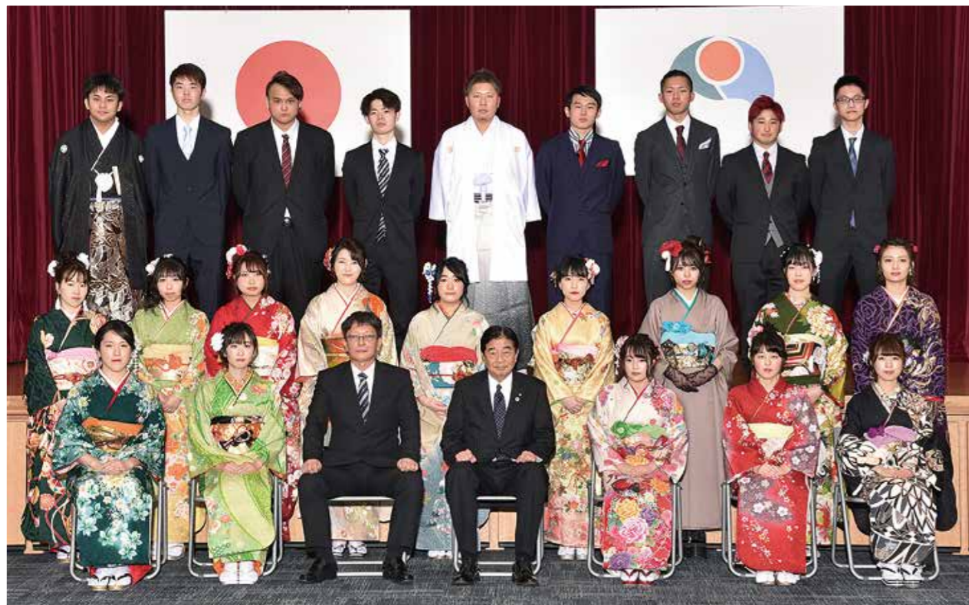
柳田中学校卒業生