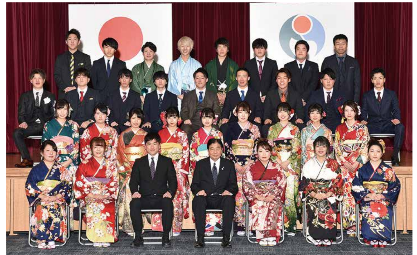
松波中学校卒業生