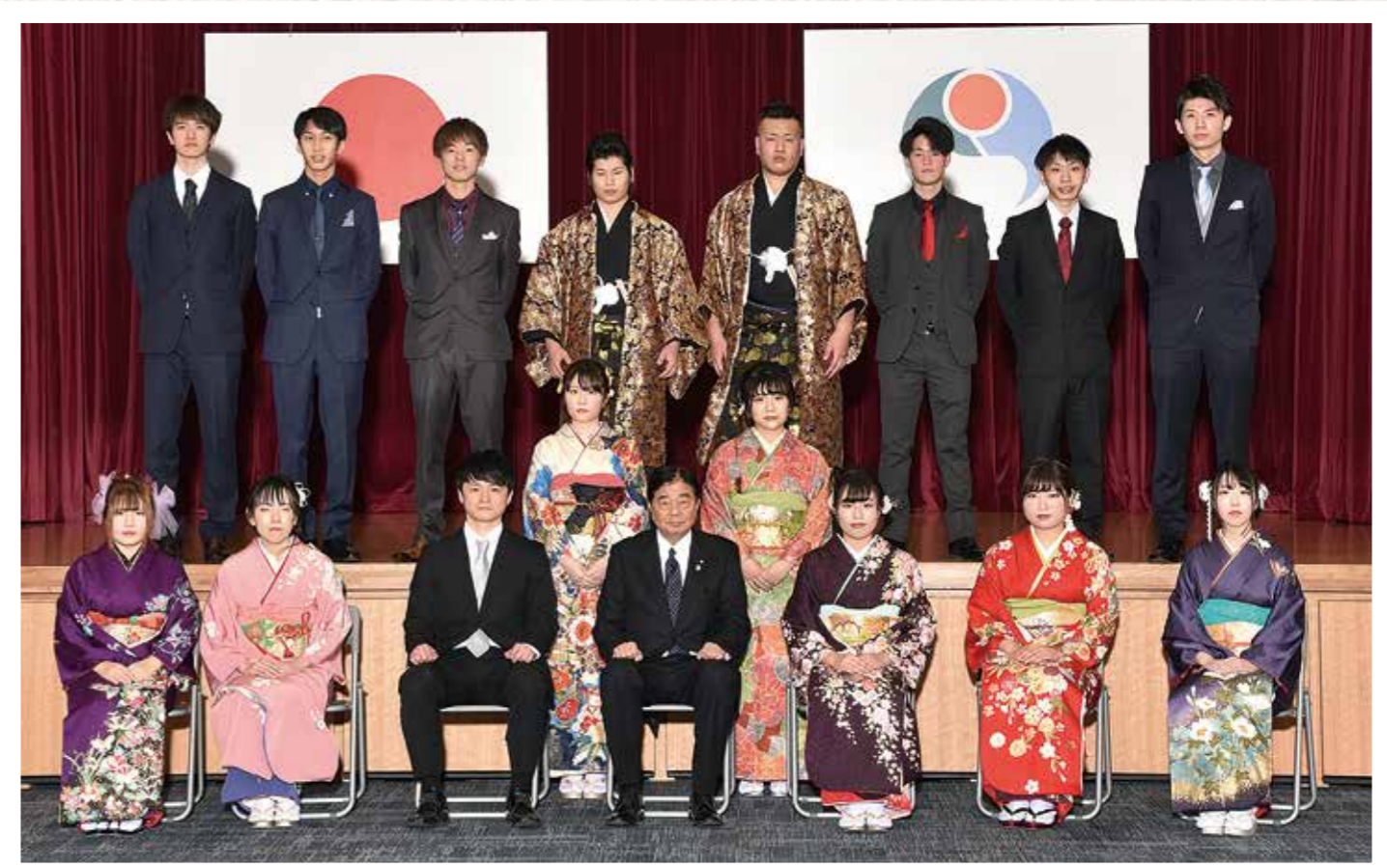
小木中学校卒業生

令和2年能登町成人式は1月12日に役場新庁舎で行われました。今年成人を迎えたのは、平成11年4月2日から平成12年4月1日まで生まれ、男性87人、女性86人の計173人です。持木町長や恩師からの祝福を受け、新成人としての第一歩を踏み出しました。会場には晴れ姿を見ようと、新成人の家族らが訪れていました。アトラクションでは、宇出津吹奏楽研究会がプラスバンド演奏を行い門出を祝いました。