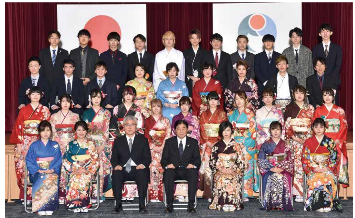
能都中学校 2組卒業生