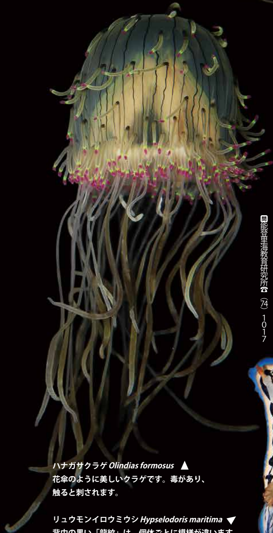
ハナガサクラゲ Olindias formosus ▲