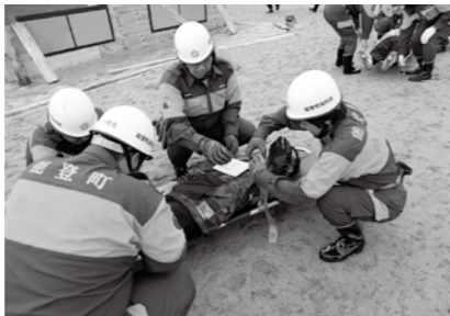
けが人を搬送する消防団員ら