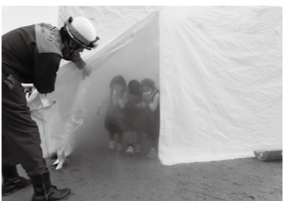
煙体験ハウスからハンカチを顔に当てて出ている児童