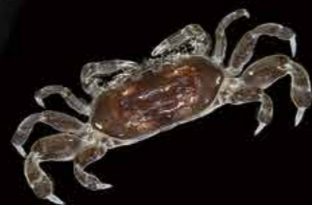
ギボシマメガニ Pinnixa balanoglossana ▲