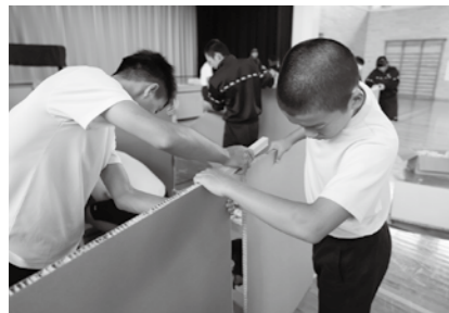
避難所では柳田中学校3年生が間仕切りを設置