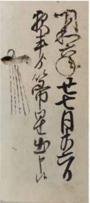
かいちゅうかきとめくら 懐中書留蔵

11月8日(金)から石川県柳田星の観察館「満天星」で開催される企画展示「宇宙に一喜一憂 江戸時代の天体ショー」で、2点の史料を含めた江戸時代の彗星やオーロラに関する記録を展示いたしますので、ぜひ足をお運びください。