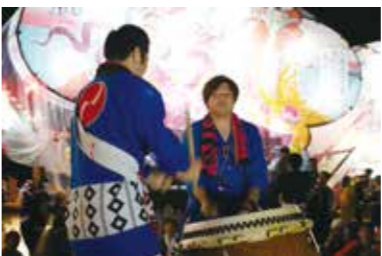
御船太鼓保存会による太鼓演奏