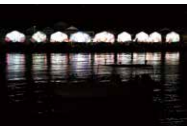
西町海岸にそろった9基の袖キリコ

御船神社の秋祭り、小木袖キリコ祭りが9月21日、22日に行われました。21日夜、神社へと続く石段を登る「宮上げ」があり、担ぎ手たちは力を合わせて担ぎ上げました。