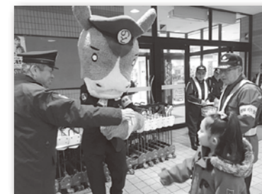
珠洲警察署 ☎82-0110 能登庁舎 ☎62-1334

町内ショッピングセンターで、振り込め詐欺被害に遭わないよう、来店者に「振り込め詐欺防止検定」を配布。注意を呼びかけました。いま一度確認を！