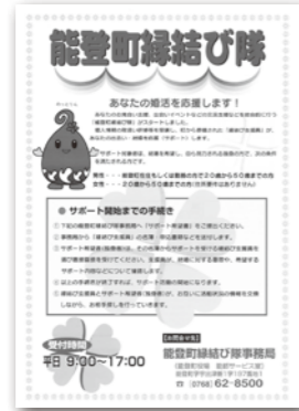
縁結び隊パンフレット(裏面がサポート希望書になっています)

サポート対象者 結婚を希望し自ら努力する独身の人で、次の条件を満たす人です。 男性:町在住もしくは勤務の人で20歳から50歳まで 女性:20歳から50歳まで(女性の住所要件はありません)