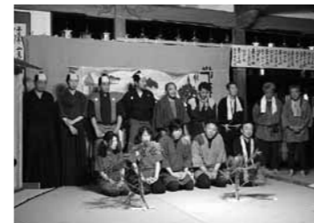
▼劇を上演した上町公民館「勘座」のメンバー