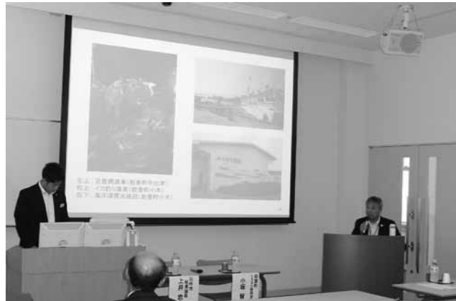
観光の新しい取り組み「聖地巡盃」を紹介

石川シティカレッジは、県内各自治体の首長や幹部が講師となり、市町のユニークな取り組みを紹介するもので、大学コンソーシアム石川が主催しています。