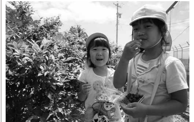
大きく実ったブルーベリーに笑顔を見せる園児