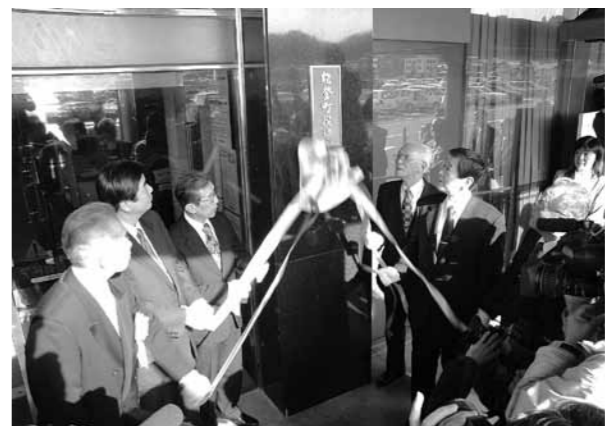
「能登町役場」の銘板序幕（平成17年3月1日）