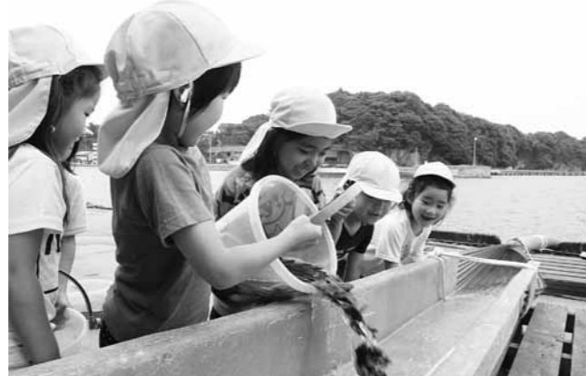
稚魚をのぞき込んで観察する園児たち