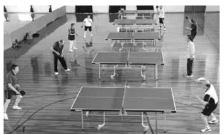
真新しい卓球台でラリーを楽しむ愛好者

能都体育館に12台ある卓球台のうち、半数の6台が新調されました。導入されたのは国内の公式大会でも使用できる、本格的な設備です。