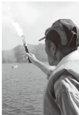
発煙筒でほかの船に非常事態を知らせる訓練

能登海上保安署とNPO法人能登海難救済会内浦救護所は7月12日、九十九湾で遊覧船海難救助訓練を行いました。