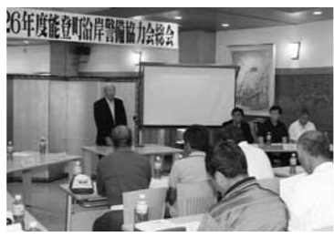
協力を呼びかける櫻井会長

能登町沿岸警備協力会の総会が6月27日にラプロ恋路で行われました。会場には会員をはじめ、珠洲警察署、能登海上保安署、県漁協など関係機関から約30人が出席。長年活動続ける会員3人に表彰状が、今年退任した4人には感謝状が贈呈されました。沿岸警備協力会は、北朝鮮による拉致事件「宇出津事件」を契機に発足した組織です。漁業者など会員44人がボランティアで活動していて、月に1回「朔の日」に約48キロある能登町の海岸線をパト