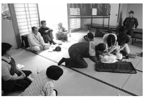
応急手当訓練に臨む参加者

近年のゲリラ豪雨や台風、突然の地震などにより全国各地で土砂災害が発生し、訓練の重要性がますます高まっています。もしもの土砂災害に備えて、みなさんも家族で避難先や必要な物など確認しましょう。