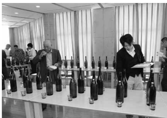
きき酒研究会で感覚を研ぎ澄ませる杜氏ら(ラプロ恋路)

能登杜氏組合では蔵人を募集しています。8月20日から22日にかけて珠洲市で開催される夏期酒造講習会にて新規就職希望者講習を予定しています。