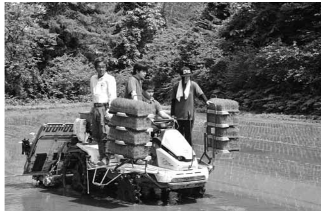
田植機を使って苗を植える県立大生ら

放流の際には「がんばってね」「大きくなって帰ってきてね」と声をかけながら、体長5センチほどの小さな稚魚の旅立ちを見守りました。