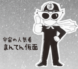
宇宙の人気者 まてん仮面