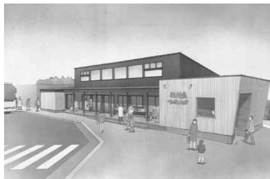
施設完成イメージ

【能登町役場】☎62-1000(代) ■能都庁舎 (FAX62-4506) 〒927-0492 宇出津新1字197番地1 総務課 ☎62-8510 企画財政課 ☎62-8503 監理課 ☎62-8504 税務課 ☎62-8505 環境対策課 ☎62-8507 町民課 ☎62-8500 能都サービス室 ☎62-8500 ふるさと振興課 ☎62-8532 会計課 ☎62-8509