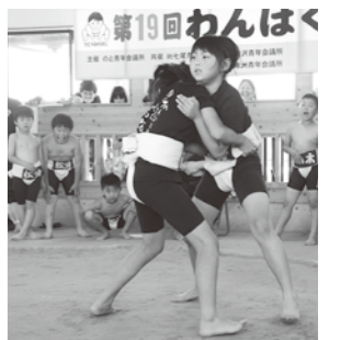
女子の部は5年生2人が熱戦を繰り広げた