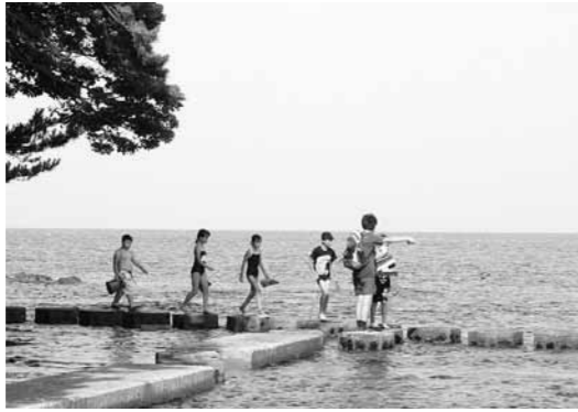
昨年のツアーで磯の観察ミッションを遂行中の参加者

姉妹都市・千葉県流山市の小学4年生6年生を迎えて「能登の自然体験学習ツアー」が今年も開催されます。流山市児童との交流を希望する能登町児童を募集しています。九十九湾周辺でミッションをクリアしながら、新しい友達を作ろう。