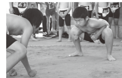
気迫十分の立ち会い