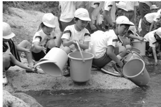
放流したアユの行方を見守る児童