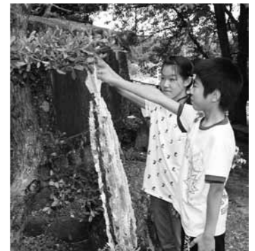
▼ 折り鶴を手向ける代表の児童