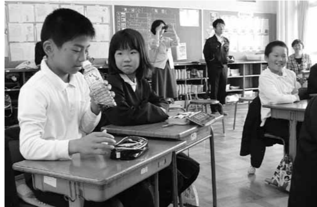
「いしる」の匂いに顔をしかめる児童