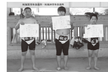
県大会出場を決めた3人