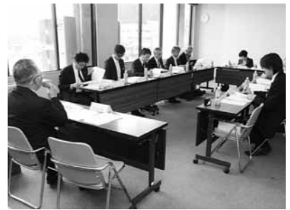
審議の様子。有識者で構成される委員が申請者に対して事業の内容を聞き取って助成額が決定された。

住民主体のまちづくり活動を支援する助成制度「公益信託能登町エンデバーファンド21」の運営委員会が4月17日に役場能都庁舎で行われました。前年度助成団体の報告のあと、本年度に申請した9団体が、自分たちの描くまちづくりについて説明しました。審議の結果、8団体に1,603万円の助成が決定しました。