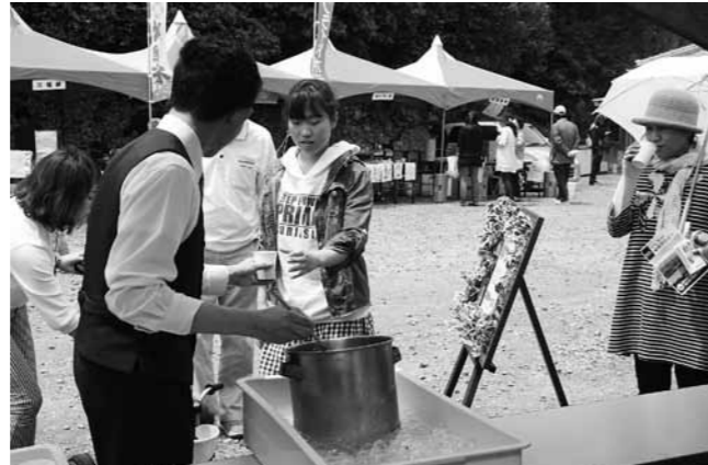
甘いイチゴミルクを味わう来場者

小木小学校で5月23日、おさかな給食があり、小木で水揚げされたイカを使ったメニューが提供されました。授業では県漁協職員がスルメイカ漁について説明したほか、給食メニューに使われている地元食材を当てるクイズも実施されました。イカの内臓から作った魚醬「いしる」のペットボトルが準備され、児童が順に匂いをかぎました。初めていしるを見た児童もいて、独特の匂いに顔をしかめていました。