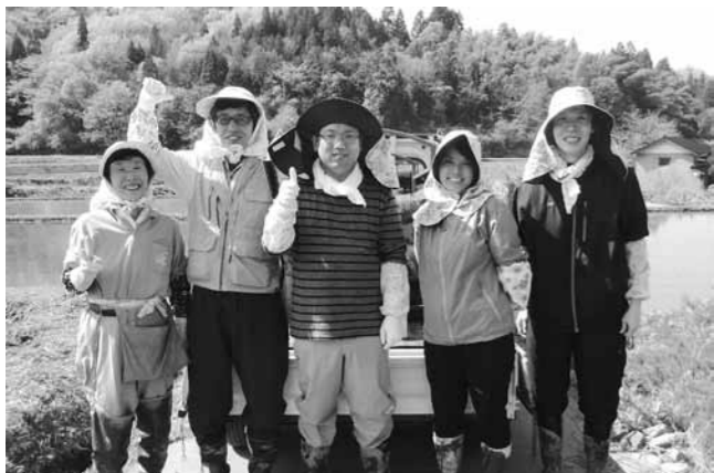
田植え作業を通じて住民と交流を深めた

受講生は住民の案内で鉢伏山周辺を巡り、ワラビやカタハなどを採りました。夜には住民を藩政期の天領庄屋「中谷家」に招いた「ヨバレ」が行われ、地元の食材を味わいました。