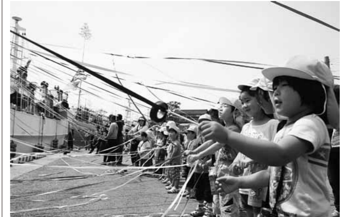
色とりどりの紙テープを握り、出港を見送る園児たち