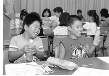
液体の変化を体験する児童（昨年の様子）

勉強の楽しさは「あれ？なぜ？どうして？」と思う心を育てることからです。今年も3つのテーマで小学生の好奇心をそそり、楽しみながら学べる内容となっています。親子で参加いただけます。