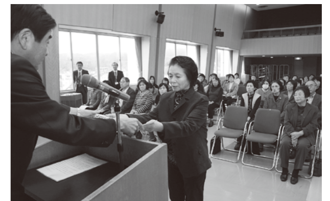
感謝状を受け取る民生児童委員

今回の委嘱で、民生児童委員は能都地区40人、柳田地区12人、内浦地区24人の合計76人、児童福祉に関する事項を専門的に担当する主任児童委員は3人となりました。