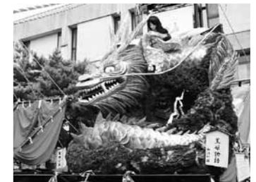
1位に輝いた「黒姫物語」