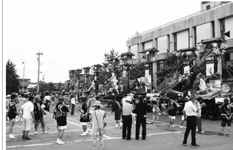
内浦福祉センター前に集結したキリコ

9基のキリコは午後2時ごろ内浦福祉センター前に集結、人形の審査が行われました。審査の結果、御坊町の「黒姫物語」が1位に輝きました。この「黒姫物語」では、嵐を起こした龍が、黒姫を背に乗せて天に昇る様が描かれています。祭りを見に訪れた人は、一つ一つの作品を携帯電話やカメラで撮影するなど、美しい人形を楽しみました。