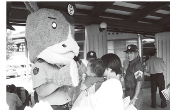
珠洲署のマスコットキャラクター「ほ～す君」も参加

この後、委員らは「なごみ」の入口でキャンペーンを実施。冷たい飲み物とチラシなどを配り、振り込め詐欺にあわないよう呼びかけました。