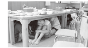
シェイクアウト訓練(7/4)