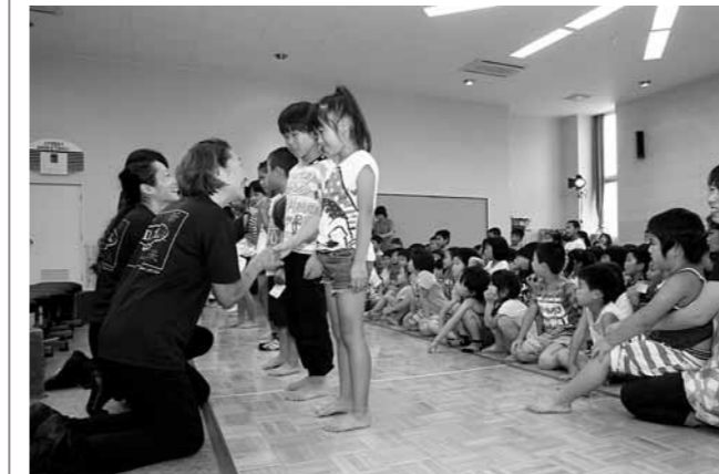
メンバーにプレゼントを手渡し、劇のお礼を述べる児童

東京から来たメンバー9人は、「さるかに合戦」や「ネズミの嫁入り」などのおはなしを披露。役になりきって表情豊かに舞台を動き回り、会場からは笑い声や歓声が絶えませんでした。