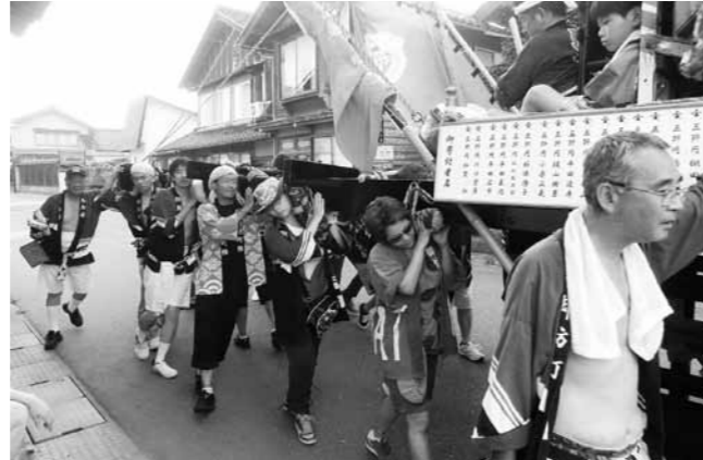
町内会の法被を着てキリコを担ぐ金沢大学の留学生