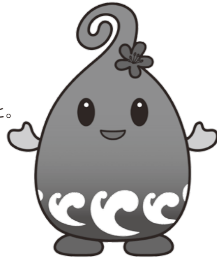
能登町イメージキャラクター【Gumpo】