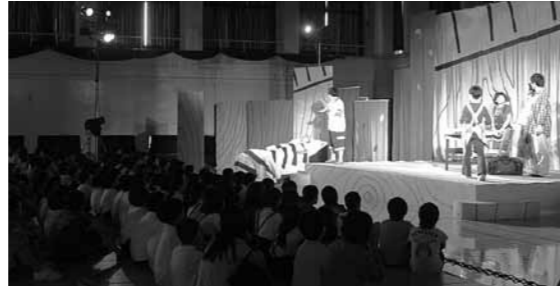
身を乗り出して舞台に見入る児童ら

演じられたのは名古屋市の劇団「うりんこ」による「ぼくはにんじやのあやし丸」です。忍者としてさまざまな技を見せるおじいちゃんと、孫である主人公の男の子との交流がコミカルに演じられ、児童の笑い声が絶えませんでした。物語では主人公の成長も描かれ、劇団員に感動の拍手が送られました。