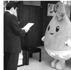
委嘱状を受け取るのっとりん

町長には「これからがんばるので応援をよろしくお願いします」とあいさつをしていました。