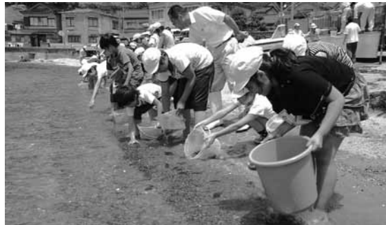
小さなヒラメを観察しながら放流

姫の沖合には約70個のコンクリート製魚礁が設置されています。今回の放流はこの一環として、栽培漁業について学んでもらおうと催されました。鶴川小児童も鶴川漁港で5000匹を放流しました。