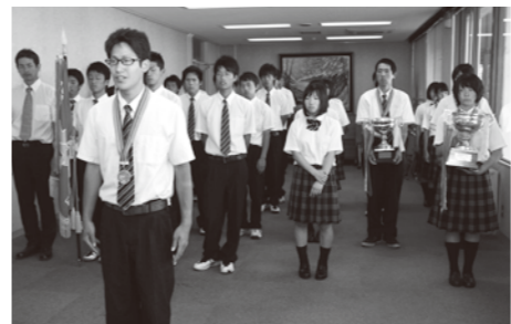
力強く決意を述べる代表の生徒

県高校総体入賞を報告 能登高校ソフトテニス部とアーチェリー部の生徒約30人が6月12日、役場能都庁舎で石川県高校総合体育大会の入賞報告を行いました。ソフトテニス部は、男子団体が優勝し北信越大会に出場。アーチェリー部も男女の団体が優勝、個人でも優秀な成績を残しました。 持木町長は県アーチェリー協会の会長でもあり、「会長として鼻が高い」と述べ活躍を喜びました。