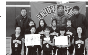
現メンバーで初優勝です

【能登高校】 第38回全日本高等学校選抜ソフトテニス大会 (3月31日) ベスト16 (1回戦 能登3-0前橋商業)