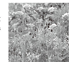
植えて良いけし (例: ヒナゲシ)

植えてはいけないけしを発見した場合は、最寄りの県保健福祉センター、薬事衛生課または警察にご連絡下さい。