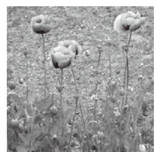
植えてはいけないけし (例: アツミゲシ)