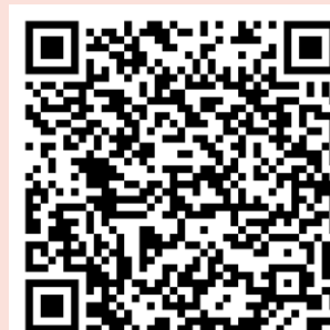
協力公衆浴場 掲載ページ

→うち、 輪島市・珠洲市・能登町・穴水町・七尾市・志賀町 の施設 ※事前受付が必要な施設もあるので、個別に確認願います