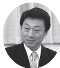
奥成 壮三郎 議員