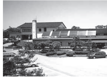
国民宿舎やなぎだ荘

は、地元食材のもてなしの心で独自性に努めておられるので、今のところ考えていない。明暗の影響を受ける業種は特別に調査していない。