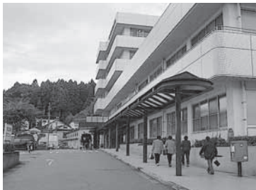
公立宇出津総合病院