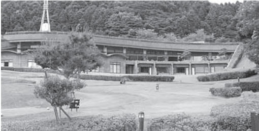
真脇ポーレポーレ

課の再編や職員の適正化など、できる限りの努力をした。 公社については、職員の雇用を含め、公益法人から株式会社へ移行することも考えている。