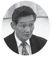
山本 一朗 議員